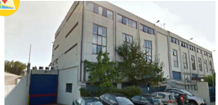
Athens ■ Artemidos 26, Metamorfoosi Tel: 211-4056400