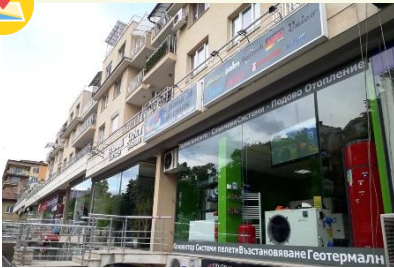
■ Bulgaria ,Blagoevgrad, Str.Cyril Methodius 29G Tel: (+359) 73-83 00 63